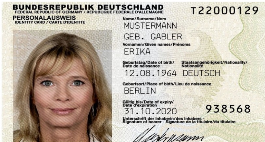
Der wohl bekannteste Personalausweis Deutschlands: Erika Mustermann, geb. Gabler.